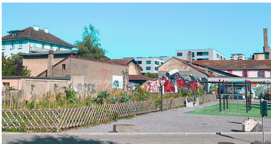
La friche de la Savonnerie se trouve au cœur de Renens. Sa position stratégique fait l'objet de toutes les convoitises. Le regard extérieur des experts permet de démêler l'écheveau.

EspaceSuisse a conseillé la commune sur la manière de mener un processus participatif avec la population pour définir plus précisément le programme ainsi que le cahier des charges du futur concours d'architecture. Elle a notamment recommandé aux autorités de clarifier leur position sur le programme souhaité, afin de cadrer le processus plutôt