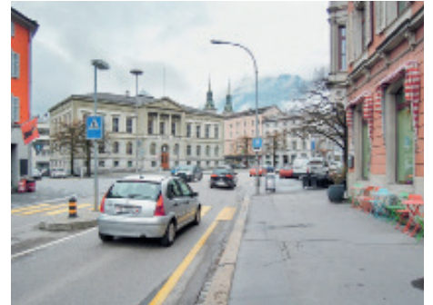
Avec le projet «Zukunft Innenstadt», la commune de Glaris gère le développement de son centre-ville. La route cantonale représente un défi de taille.

Que ce soit au sein de la commune ou chez les privés, ce genre de processus libère des énergies qui compensent largement l'argent investi. Nous avons mis en place une plateforme qui permet à de nombreux acteurs de s'impliquer. Cela soulève une question de principe: est-ce le rôle de la commune de s'occuper de son centre? La réponse est très certainement oui, mais la commune ne peut pas tout faire toute seule. Il faut qu'elle ait le courage de mettre en place un cadre auquel tout le monde puisse s'adosser, et qui